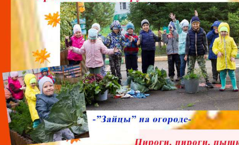
"Зайцы" на огороде-